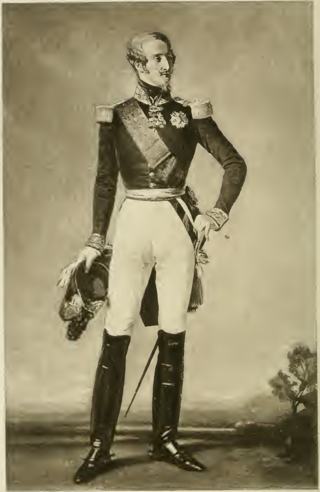
Portrait of General B...